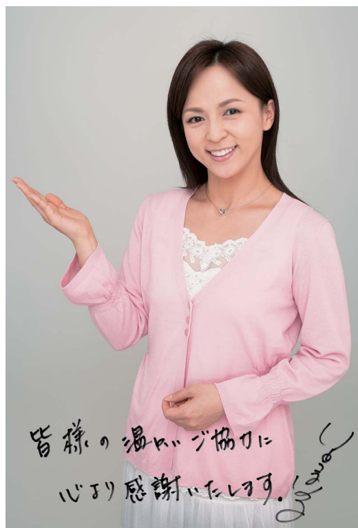
イメージキャラクター：いとうまい子