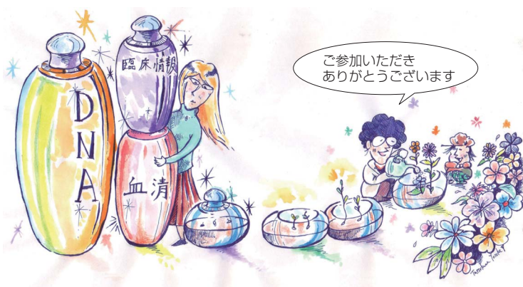
イラスト：立川陽介（バイオバンク通信8号より）